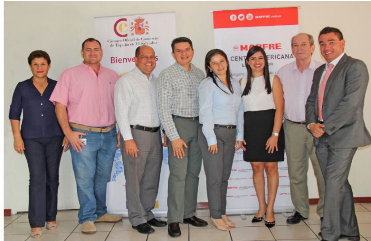
EMPRESARIOS SALVADOREÑOS PARTICIPAN EN FORO CONSTRUCCIÓN EN ASTURIAS (ESPAÑA)

Participación en Foros y Ferias Internacionales